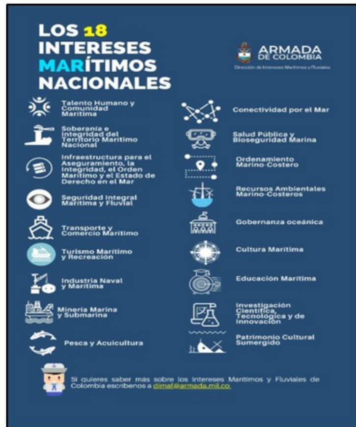
Figura 2. Intereses Marítimos Nacionales de Colombia

para garantizar su propia seguridad (Cleverson 2023). La defensa nacional comprende la preparación, la organización y el empleo de todas las fuerzas del país para garantizar la integridad nacional en toda circunstancia. Comprende la defensa militar y la defensa civil” (Escuela 2018). Garantizando así la supervivencia de su población a través de la defensa de la soberanía y aprovechamiento de los intereses marítimos estratégicos predominantes en su territorio (Figura 2), evidenciando la importancia que Colombia como tiene como país bioceánico así: