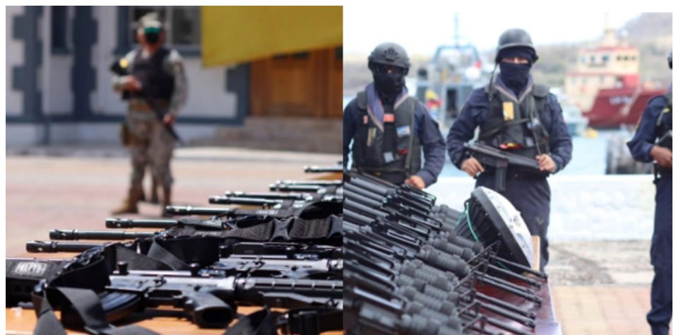
Figura 3. Incautación de armas en una lancha rápida

La hipótesis sobre la existencia de otras rutas se confirmó cuando, el 17 de noviembre de 2023, la Armada del Ecuador llevó a cabo una operación de interdicción en la zona económica exclusiva ecuatoriana, específicamente en el área insular, a aproximadamente cien millas náuticas de las Islas Galápagos. Durante esta operación, se interceptó una lancha de pesca artesanal modificada que navegaba en la Ruta Sur de Galápagos. Como resultado, se aseguraron 122 fusiles AK, M4 y R15, 48 pistolas y 124 cargadores, en lo que podría considerarse uno de los mayores decomisos registrados en la región, tal como se observa en la Figura 3 (Comando de Operaciones Navales 2024).